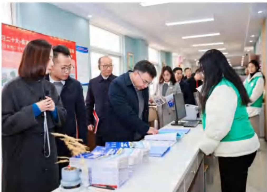
(与会人员参观安徽文达信息工程学院“一站式”学生社区)

凡市场星报、安徽财经网、掌中安徽记者署名文字、图片，版权均属于市场星报所有。任何媒体、网站或者个人，未经授权不得转载、链接、转帖或以其他方式复制发表；已经授权的媒体、网站，在转载使用时必须注明“来源：市场星报、安徽财经网或者掌中安徽”，违者本单位将依法追究法律责任。