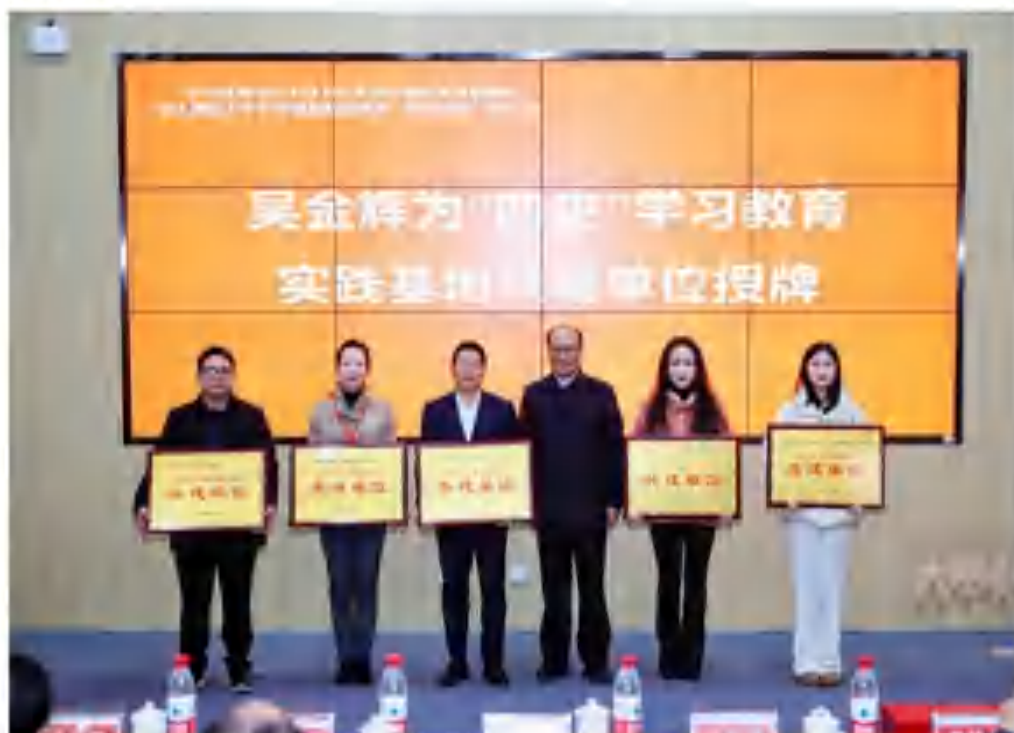
(“四史”学习教育实践基地共建单位授牌仪式)

会议期间，与会代表参观了长三角红色文化校园展、大学生教育成果展和“一站式”学生社区。